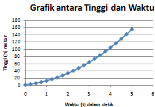
Gambar 2. Hubungan antara Ketinggian ( h ) dan Waktu ( t )

Untuk melihat bagaimana hubungan h dan t ke duapuluh data tersebut adalah dengan membuat grafik antara h dan t . Variabel bebas adalah t sebagai absis (biasanya sumbu x ) dan variabel bergantung adalah h sebagai ordinat (biasanya sumbu y ). Hubungan antara h dan t dapat dilihat pada Gambar 2.